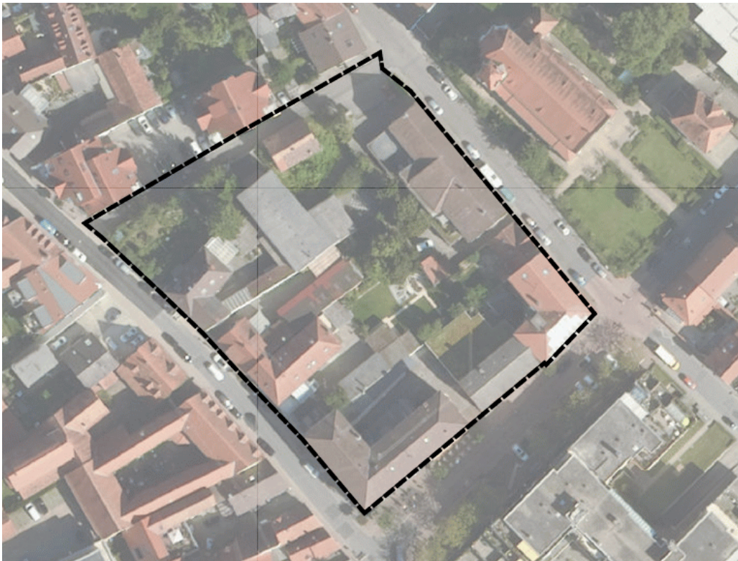
Abb. 1: Untersuchungsraum (UR) zur artenschutzfachlichen Potenzialabschätzung

Der Untersuchungsraum (UR) befindet sich im Ortskern der Gemeinde Oftersheim südwestlich von Mannheim in Baden-Württemberg und wird vollständig von Siedlung, Bebauung bzw. Straßenraum umgeben. Durch die innerörtliche Lage wurde das UR auf den Geltungsbereich sowie angrenzende Bereiche begrenzt (Abb. 1). Es lässt sich durch bestehende Bebauung und Hausgärten charakterisieren, einen bereits anthropogen überformten Lebensraum darstellen. Nachfolgend ist der UR dargestellt: